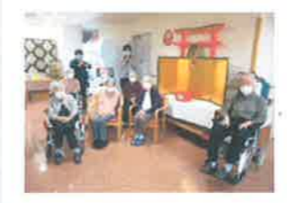
↑ふれあいユニット ~集合写真を撮りました~