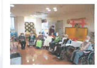
↓ぬくもりユニット