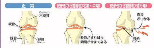
変形性ひざ関節症の診断は整形外科医の診察とレントゲンなどの検査を受けましょう

年齢を重ねるにつれて「ひざの軟骨」がすり減り、痛みや腫れ、曲げ伸ばしの制限とともに「ひざの変形」が起こる病気です。